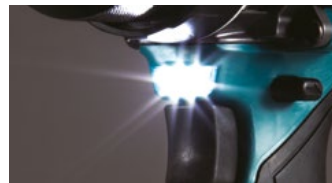
Luz LED de trabajo incorporada.