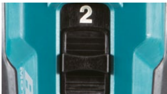
2 velocidades mecánicas.