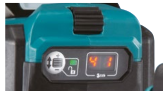
Dial para un ajuste rápido y sencillo.